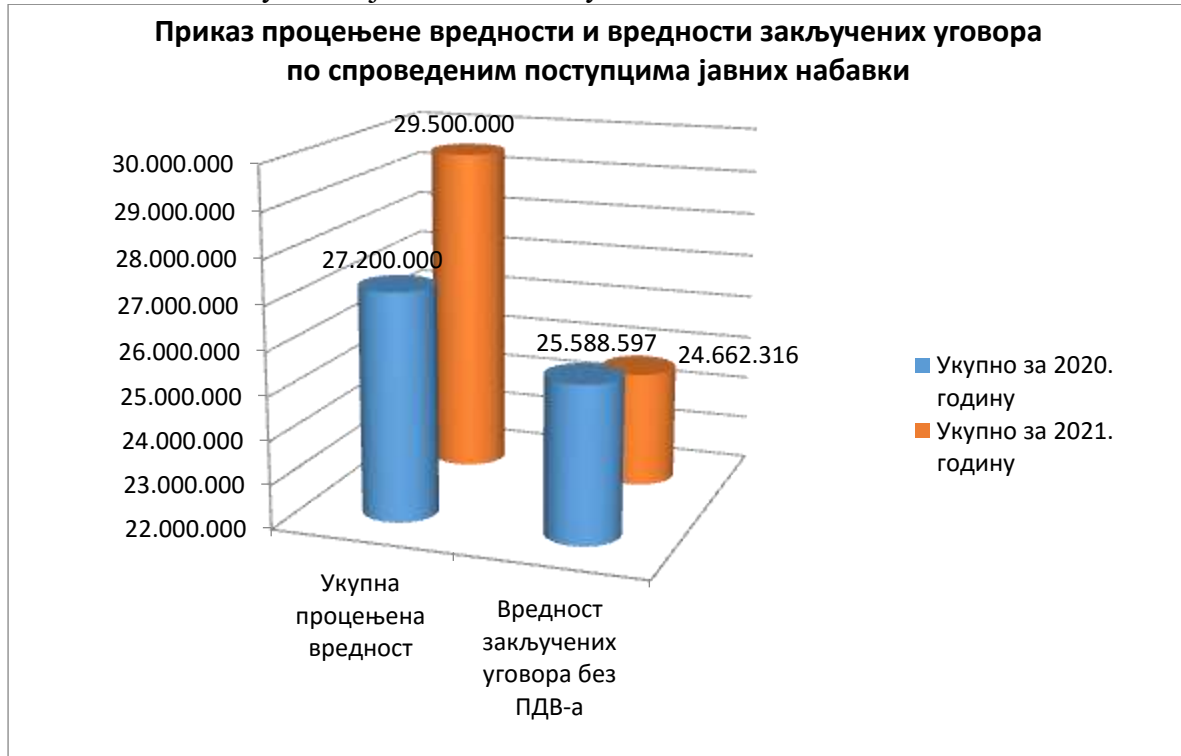
График 1: Приказ процењене и вредности закључених уговора по спроведеним поступцима јавних набавки у 2020. и 2021. години

У наредном табеларном прегледу дат је приказ појединачних јавних набавки за 2020. и 2021. годину обухваћених у поступку ревизије: